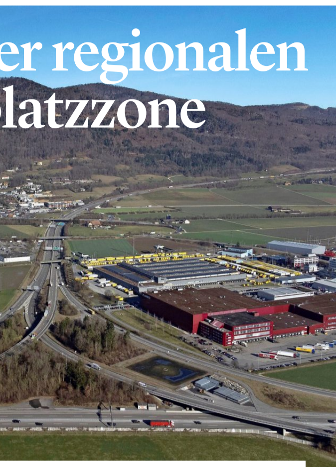
Blick auf das Autobahnkreuz Härkingen. In diesem Gebiet ist die regionale Arbeitsplatzzone ange-dacht.

Das Projekt bewegt sich laut Schmid «in einem sensiblen Spannungsfeld». Einzonungen, grosse Bauprojekte und Verkehrsbelastung beschäftigen die Gäuer Bevölkerung. Gleichzeitig sei die wirtschaftliche Entwicklung weiterhin wichtig für die Region – gerade in wirtschaftlich unsicheren Zeiten. «Man kann sagen, eine weitere Entwicklung sei nicht er-