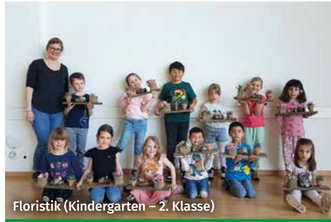
Floristik (Kindergarten – 2. Klasse)