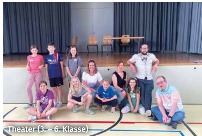
Theater (3. – 6. Klasse)