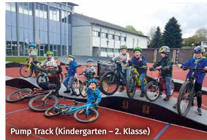
Pump Track (Kindergarten – 2. Klasse)