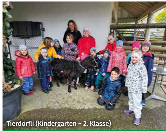
Tierdörfli (Kindergarten – 2. Klasse)