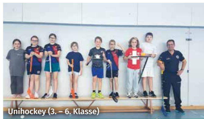
Unihockey (3. – 6. Klasse)