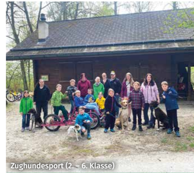
Zughundesport (2. – 6. Klasse)