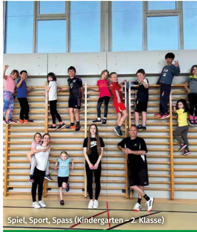
Spiel, Sport, Spass (Kindergarten – 2. Klasse)