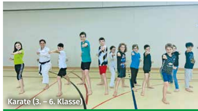
Karate (3. – 6. Klasse)