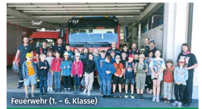
Feuerwehr (1. – 6. Klasse)