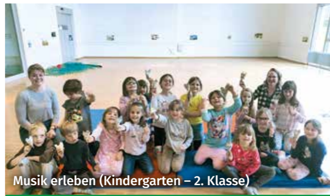
Musik erleben (Kindergarten – 2. Klasse)