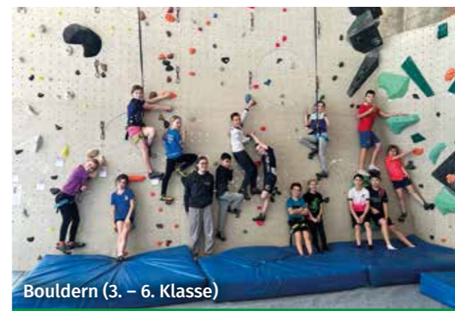
Bouldern (3. – 6. Klasse)