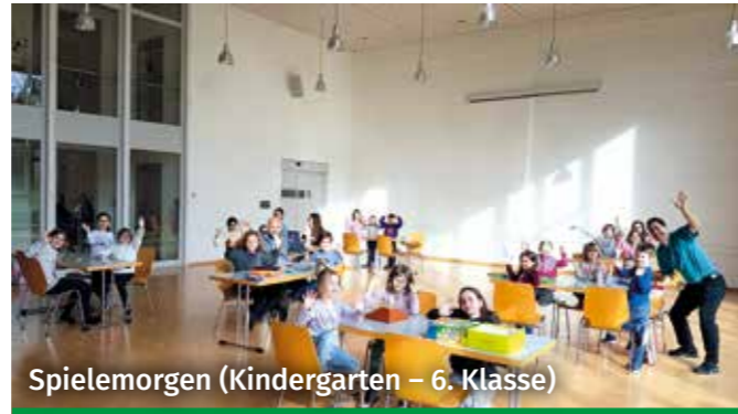
Spielmorgen (Kindergarten – 6. Klasse)