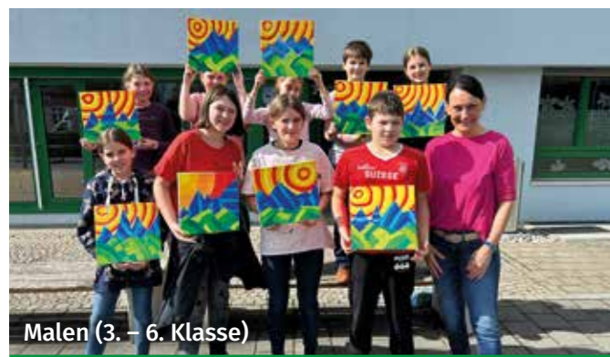
Malen (3. – 6. Klasse)