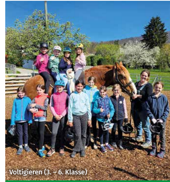
Voltigieren (3. – 6. Klasse)