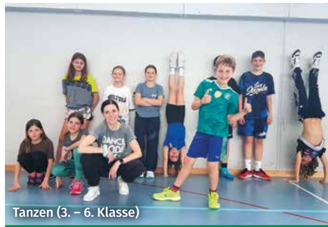
Tanzen (3. – 6. Klasse)