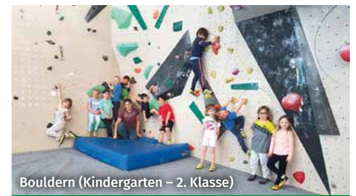
Bouldern (Kindergarten – 2. Klasse)