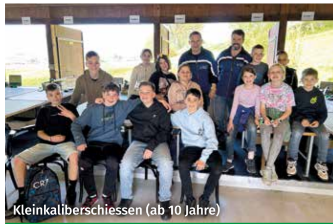
Kleinkaliberschiessen (ab 10 Jahre)