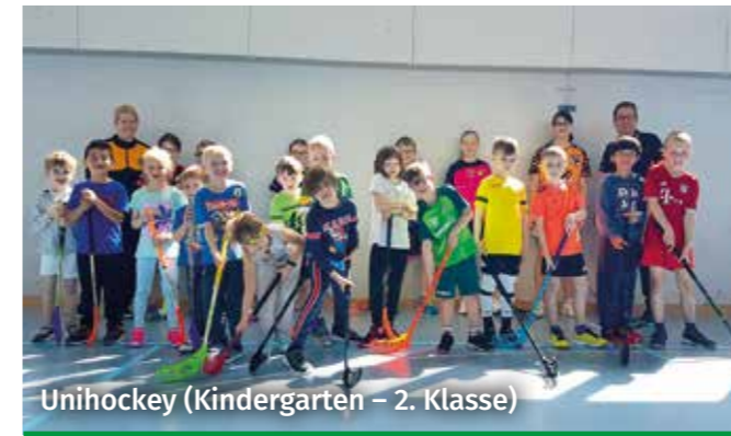
Unihockey (Kindergarten – 2. Klasse)