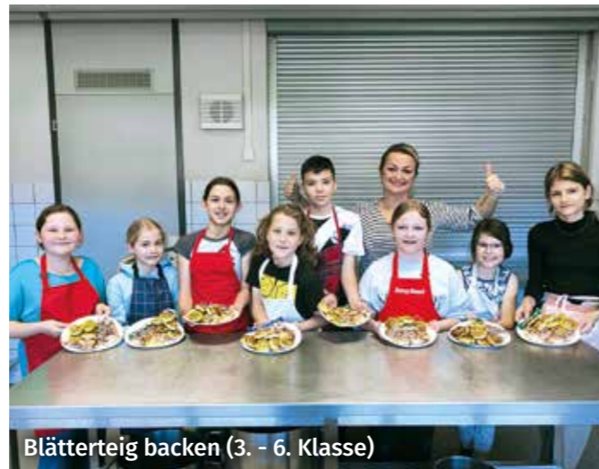
Blätterteig backen (3. - 6. Klasse)