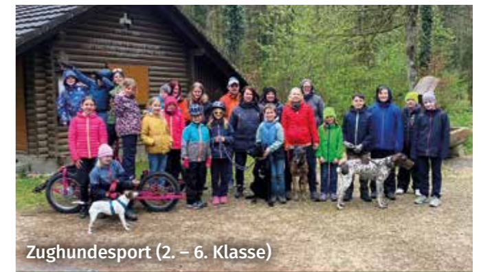
Zughundesport (2. – 6. Klasse)