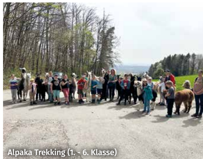
Alpaka Trekking (1. - 6. Klasse)