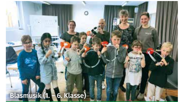
Blasmusik (1. – 6. Klasse)