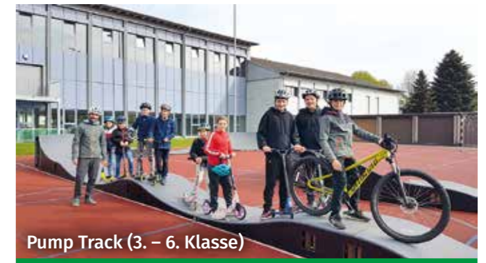
Pump Track (3. – 6. Klasse)