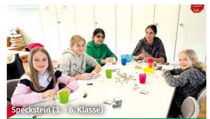
Speckstein (3. – 6. Klasse)