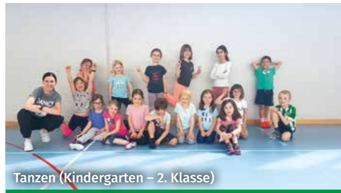
Tanzen (Kindergarten – 2. Klasse)