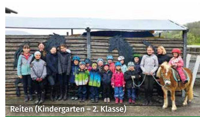
Reiten (Kindergarten – 2. Klasse)