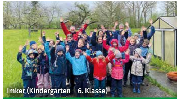
Imker (Kindergarten – 6. Klasse)