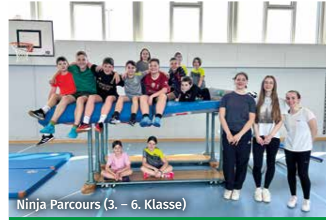
Ninja Parcours (3. – 6. Klasse)