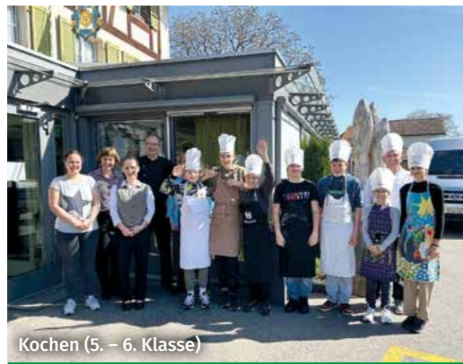
Kochen (5. – 6. Klasse)