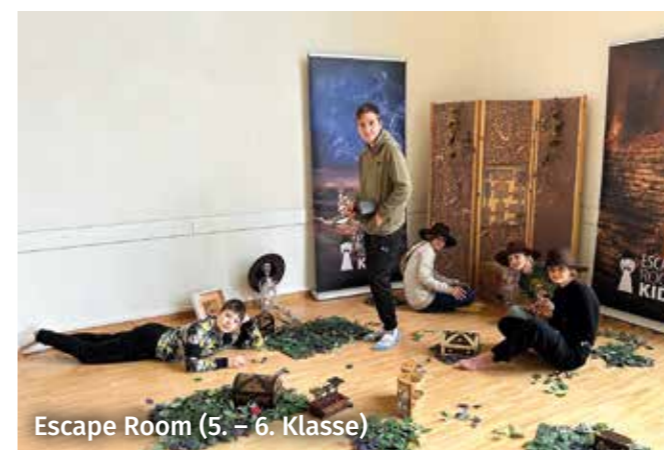
Escape Room (5. – 6. Klasse)