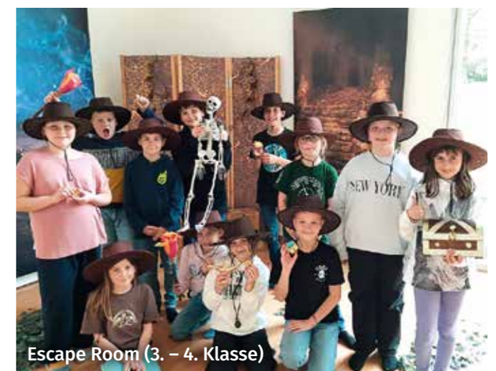
Escape Room (3. – 4. Klasse)