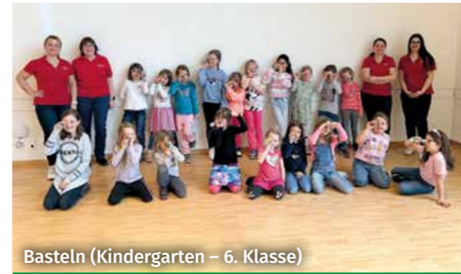
Basteln (Kindergarten – 6. Klasse)