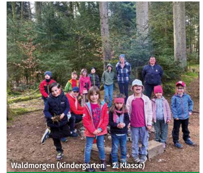
Waldmorgen (Kindergarten – 2. Klasse)