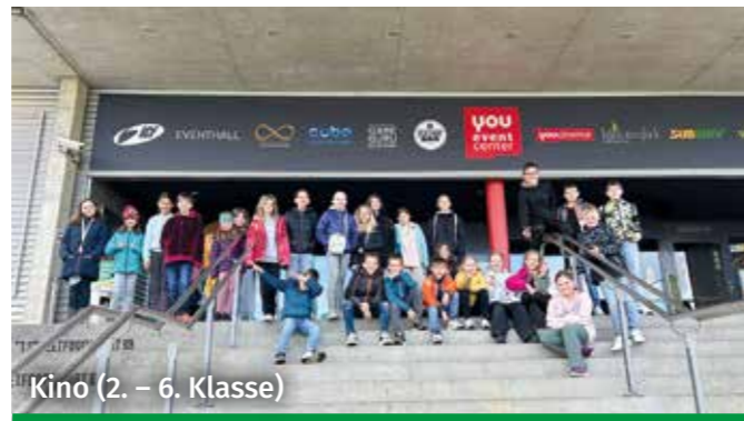
Kino (2. – 6. Klasse)