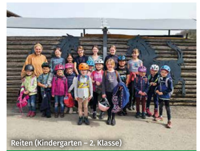
Reiten (Kindergarten – 2. Klasse)