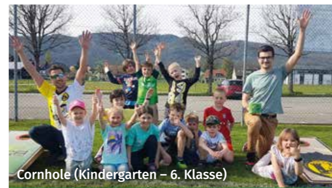
Cornhole (Kindergarten – 6. Klasse)