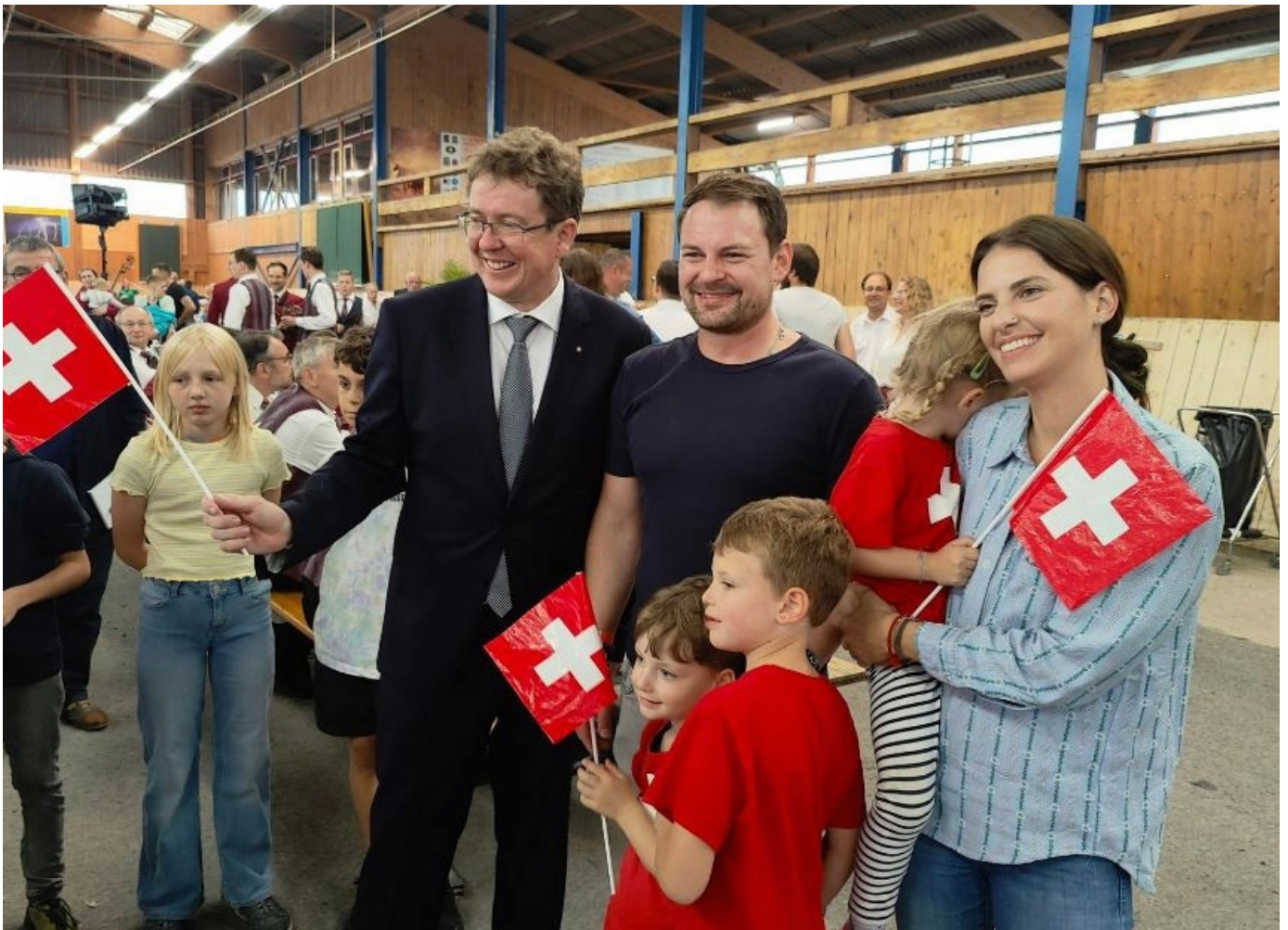
Albert Rösti an der Bundesfeier.

«Die Schweiz hat nicht gemacht, was die anderen machten. Sondern gerade das Gegenteil. In Zeiten der Monarchien wählte sie die Demokratie», sagte der Energie- und Umweltminister. Dieser Sonderweg der Schweiz sei der Schlüssel zu ihrem Erfolg.