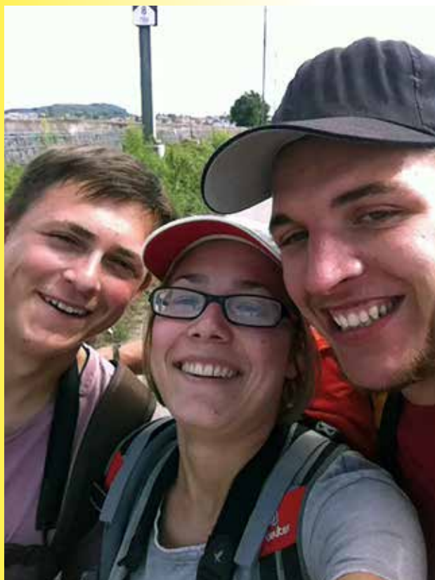
Das Team «Gäuschwalben»

Beim Schweizer Bird Race, welches jährlich am ersten Septemberwochenende stattfindet, handelt es sich um einen Sponsorenlauf: Teams aus drei bis vier Personen machen sich auf die Suche nach möglichst vielen Vogelarten. Sie haben 24 Stunden Zeit (von 21 Uhr bis 21 Uhr) und dürfen nur öffentliche Verkehrsmittel oder die eigene Muskelkraft benutzen. Im Vorfeld suchen die Teams Spenderinnen und Spender, die BirdLife Schweiz pro gesichtete Art einen frei wählbaren Betrag spenden.